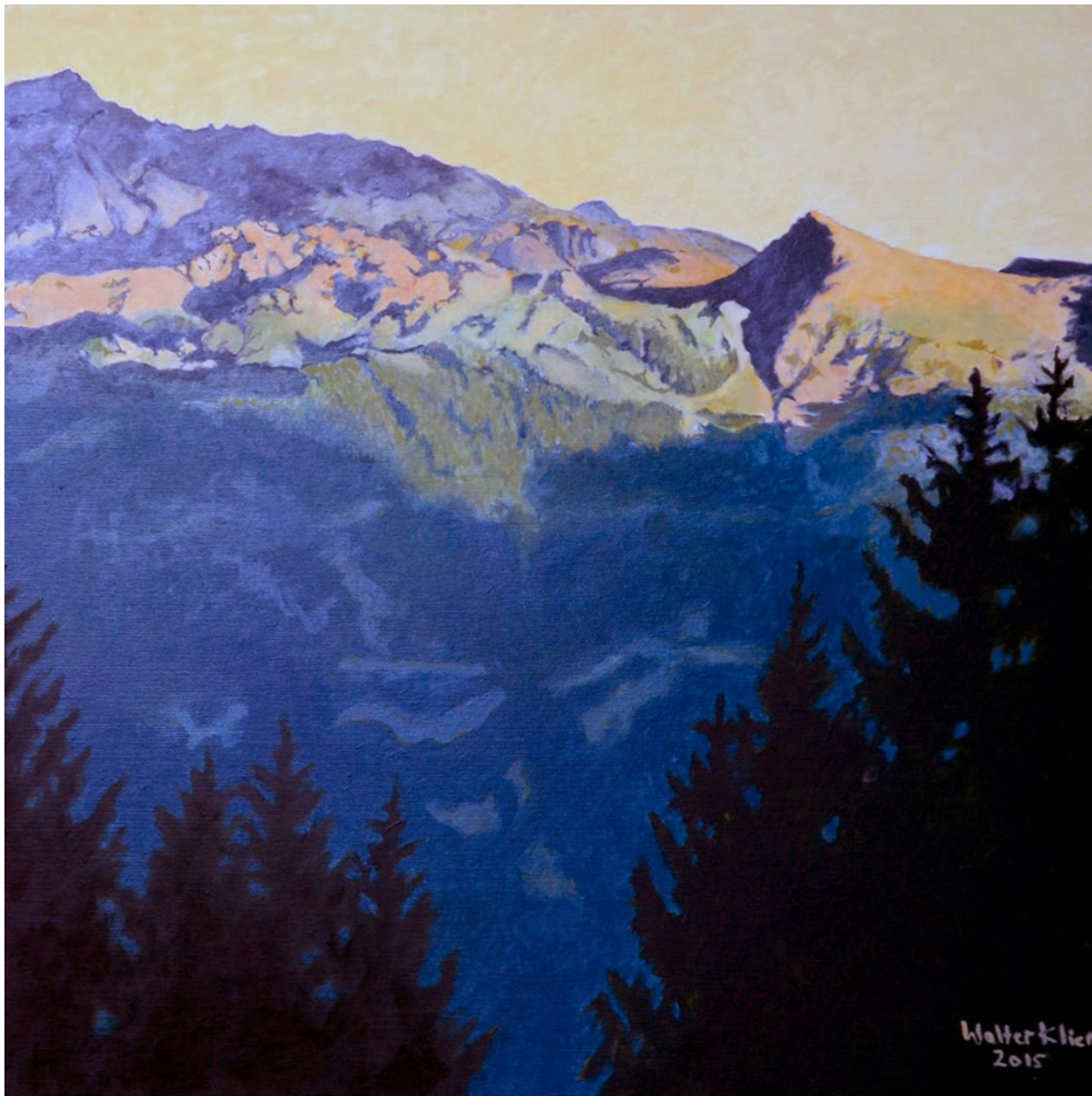
Glungezer im Abendlicht , 50 x 70 cm, Öl auf Leinwand © Walter Klier, 2015