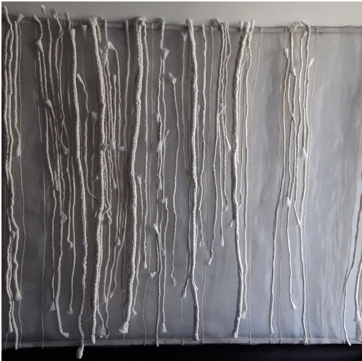
Textilien von Metall_Radierungen zum Thema Weben I, 50 x 70 cm, Radierung © Barbara Fuchs, 2023