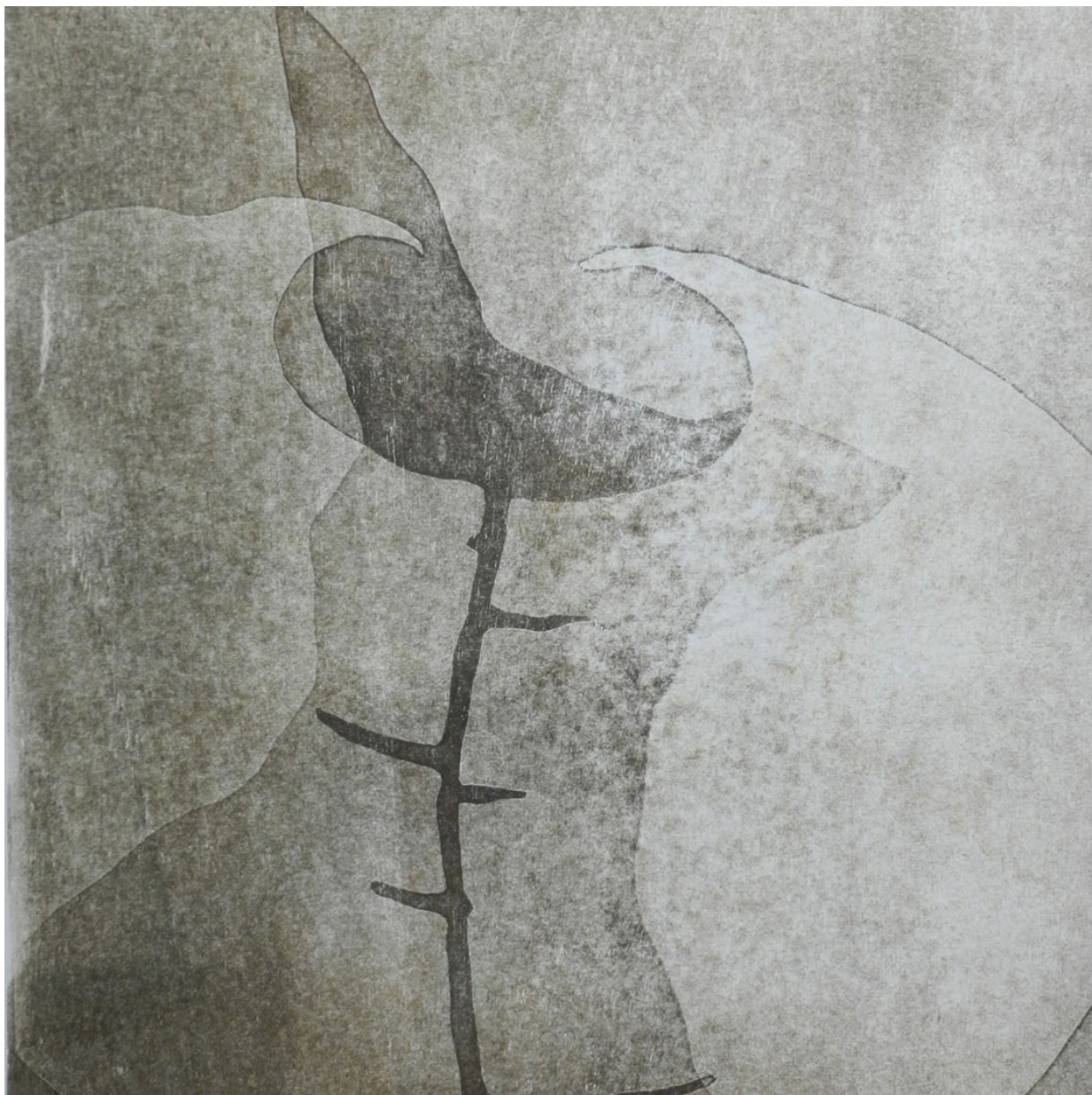
State of the world, 40 x 50 cm, Holzdruck © Manfred Egger, 2024