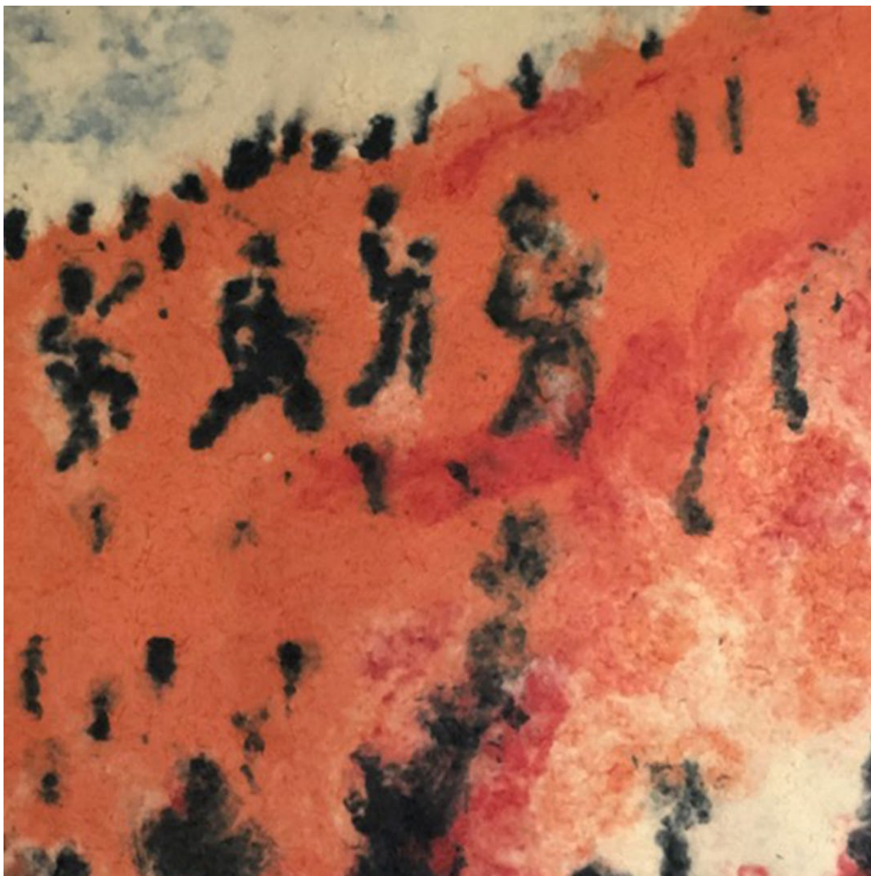
Schrein, Modell © Paulus Ramstorfer, 2024