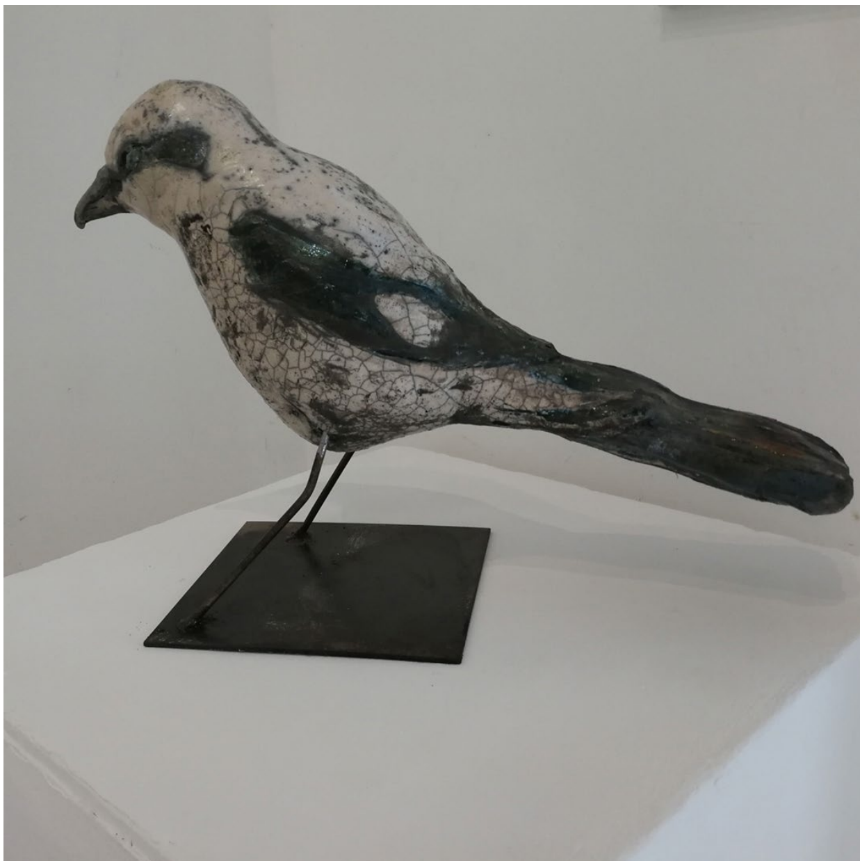
Serie Bedrohtes_ Raubwürger , 30 x 18 x 50 cm, Keramik/ Raku, Metall © Elisabeth Ehart-Davies, 2022-23