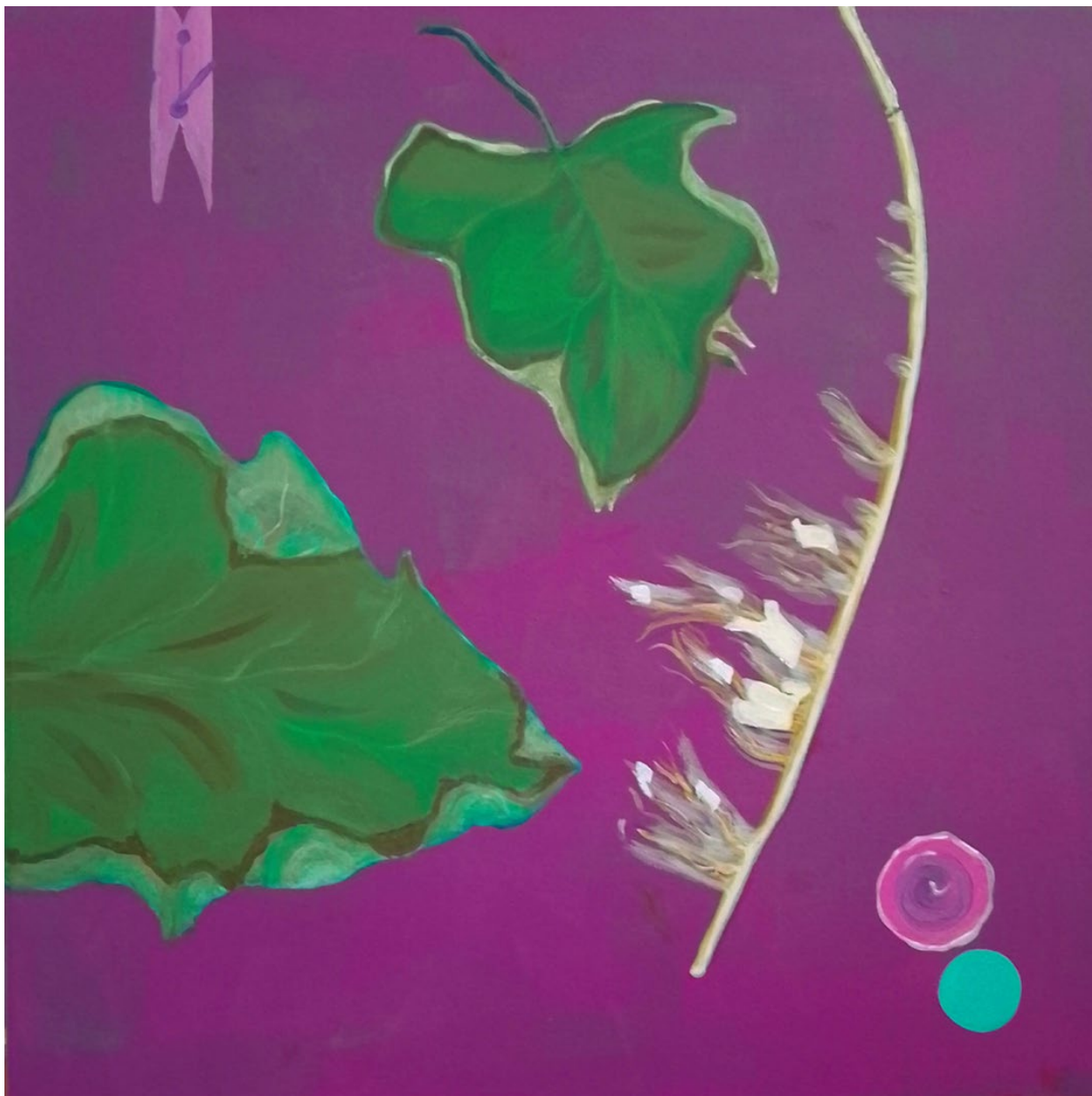
< Zwiegespräche > aus der Serie sinnig_unsinnig, 50 x 50 cm, Acryl auf Leinwand © Ina Luttinger, 2024