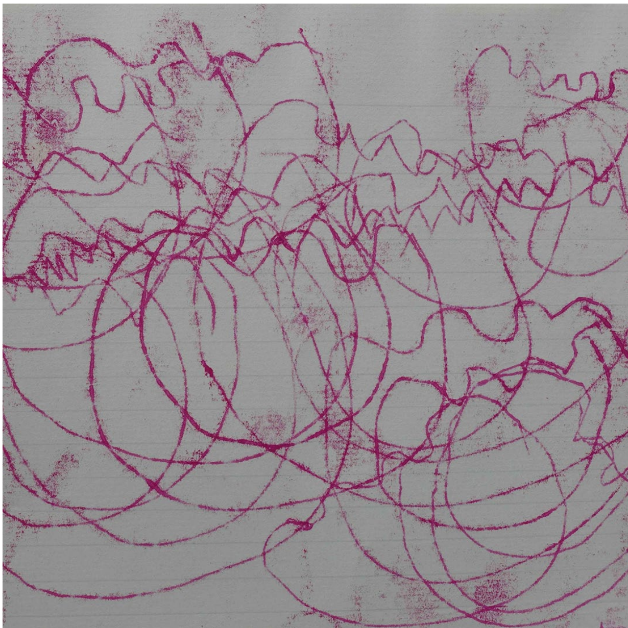
letter to the island 2 , 19 x 23 cm, Monotypie © Anna Maria Achath, 2024