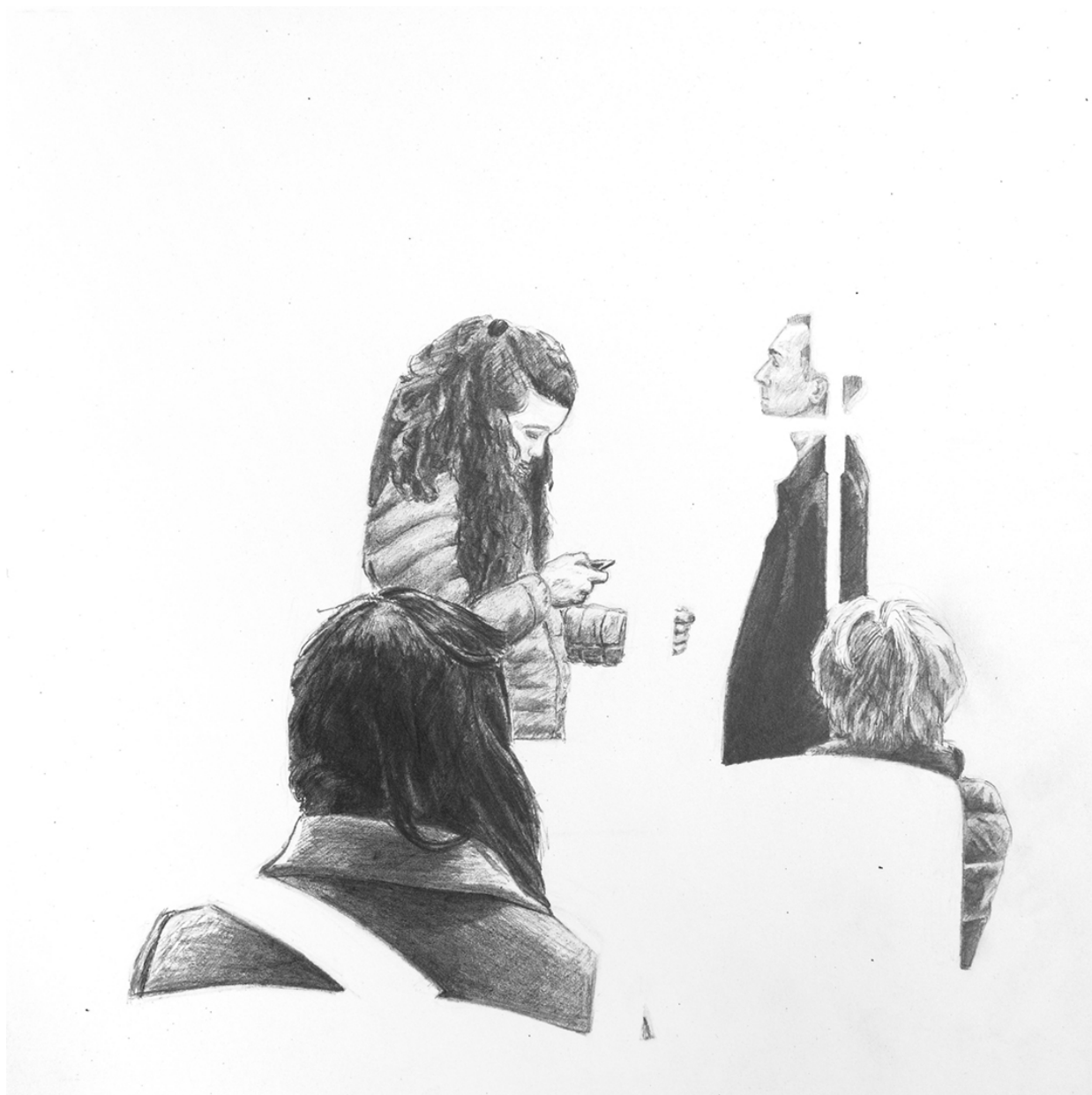
Unterwegs III , 20 x 21 cm, Bleistift © Johannes Davies, 2018