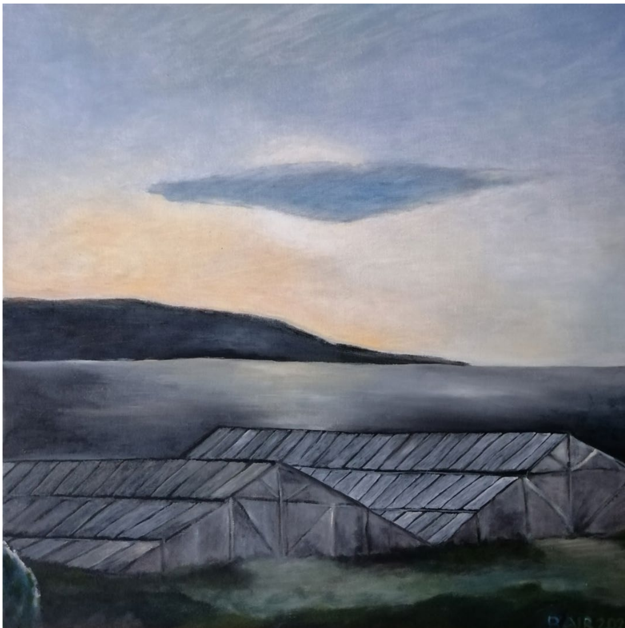
Glashäuser , 50 x 50 cm, Öl auf Leinwand © Johanna Bair, 2020