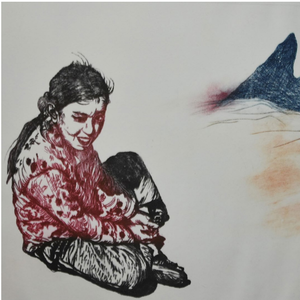
Türkisches Mädchen , Zyklus „Was ist Mensch“ 40 x 50 cm, Kaltnadelradierung © Elisabeth Melkonyan, 2013